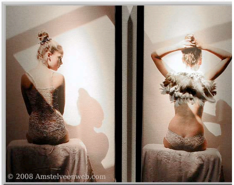
Annette van Waaijen: van de serie 'Niet naakt'. Foto op linnen, katoen en borduurzijde