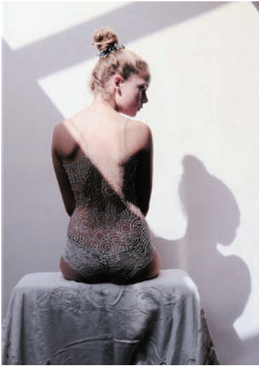
Niet naakt (Bodysuit), 2008. Formaat 43 x 28 cm.