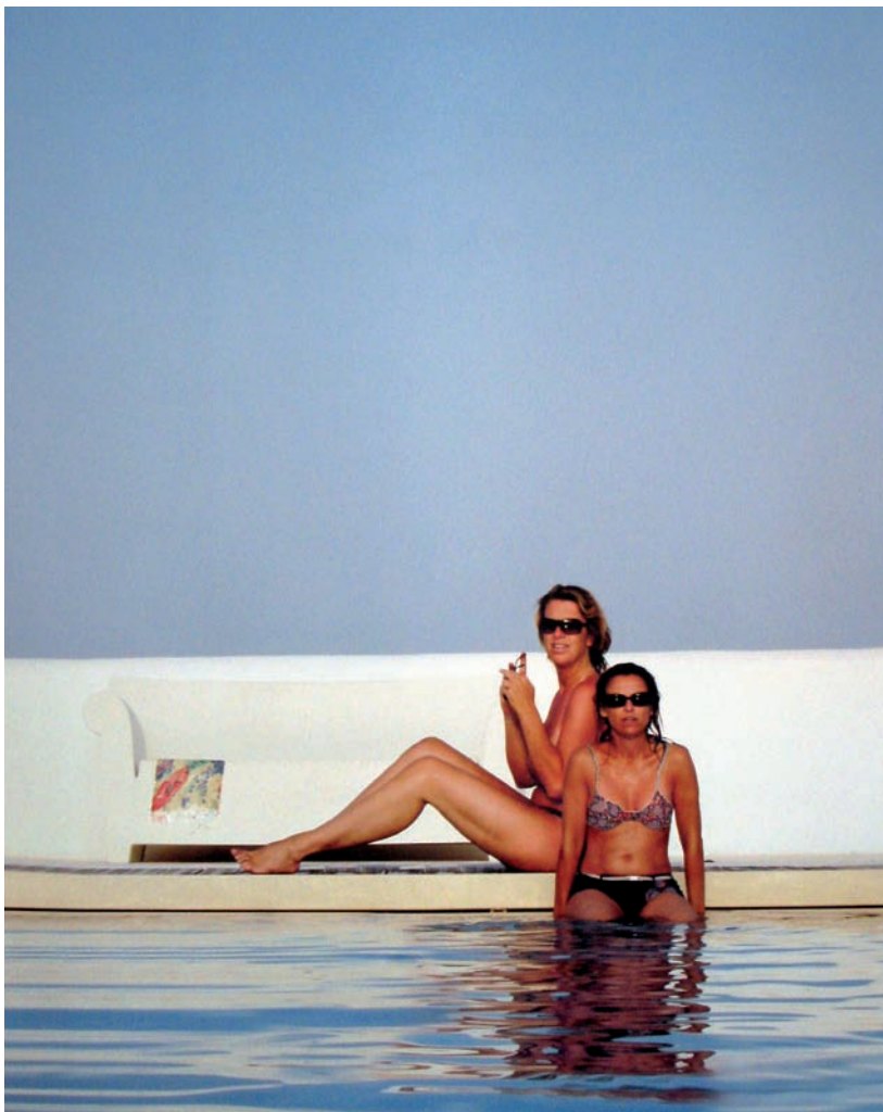
Niet naakt (Puglia-II), 2008. Formaat 95 x 130 cm.

De tentoonstelling is te bezichtigen tijdens kantooruren in het atrium van de Sociale Verzekeringsbank, Van Heuven Goedhartlaan 1, Amstelveen