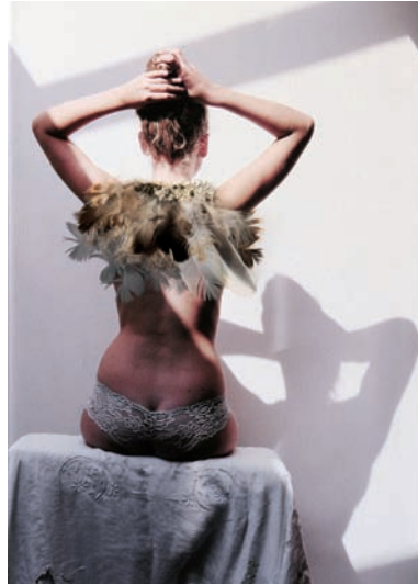
Niet naakt (veren), 2008. Formaat 43 x 28 cm.

Waar ik in de beelden vooral naar zoek zijn situaties waar het licht een grote rol speelt. Dit kan toevallig zijn omdat er was buiten hangt waar net, door een gat in de bewolking, de zon op schijnt. Maar ook in een opzettelijke situatie, in het geval van de 'Niet naakte'-dames voor een vitrage, is dit een belangrijk onderdeel van de foto. In het laatste geval kan ik met borduurwerk (van de stippen op de vitrage) het licht en donker extra benadrukken. De dames zijn gekleed in antieke zakdoekjes die ik in mijn ouderlijk huis vond en van mijn oma zijn geweest. De antieke zakdoekjes gebruik ik ook om in Venetië extra was buiten te hangen of om bijvoorbeeld was te hangen in een mini-landschap met hoogspanningslijnen.